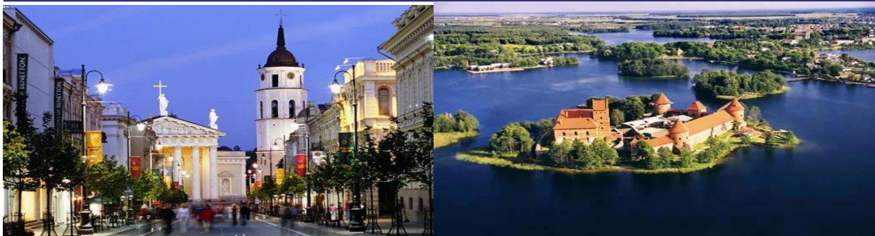
VILNIUS I TRAKAI

IBAN: HR5524020061100074777 • HR8724840081104209341